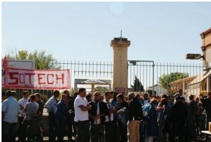
Alors que le comité d'entreprise était en réunion hier après-midi, le personnel était regroupé devant les portes du site.

Hier après-midi, le plan social suivant la cession du site à Maxam était présenté en CE.